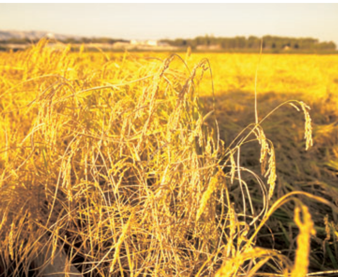
La introducción del cultivo de arroz atenuó la crisis agraria en Murcia.